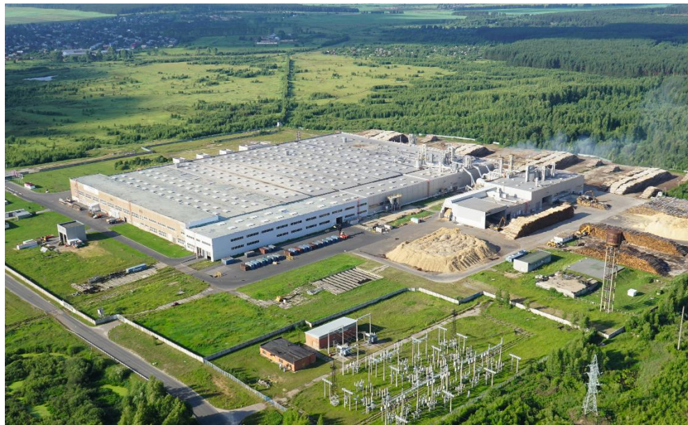
Завод EGGER в г. Шуя